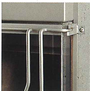
DE DEURHENDEL HEEFT EEN VERGRENDLING DIE TEVENS DE LUCHTTOEVOER REGELT